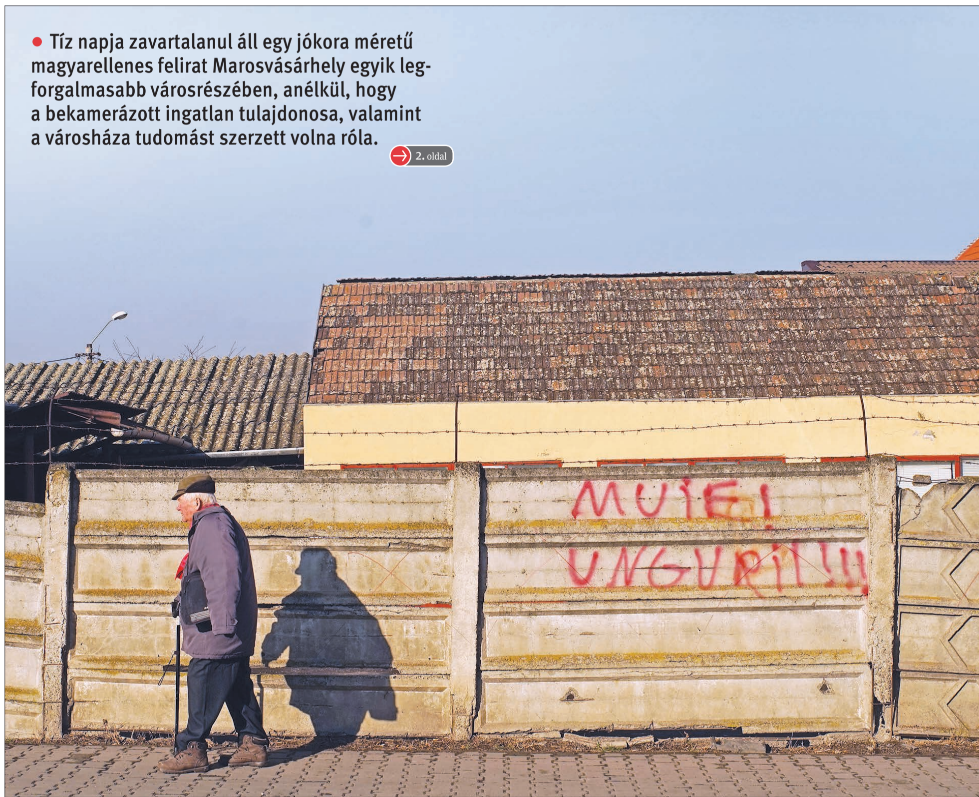
Csak sejteni lehet, hogy mikor került a kerítésre a felirat