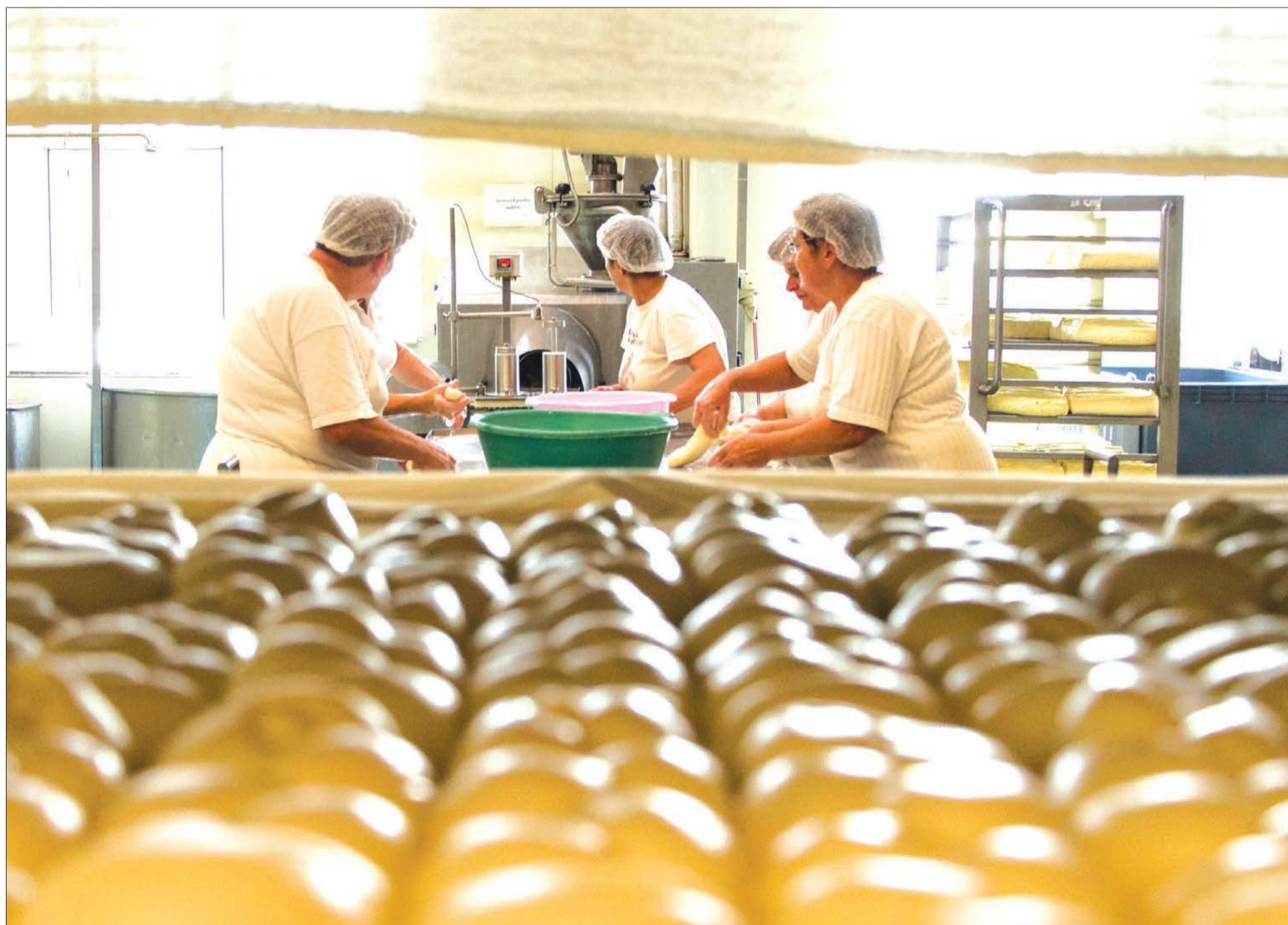
Székelyföldi tejfeldolgozó. További fejlesztésekre lehet pályázni

Székelyföldi feldolgozók létesítését támogatja a magyar állam