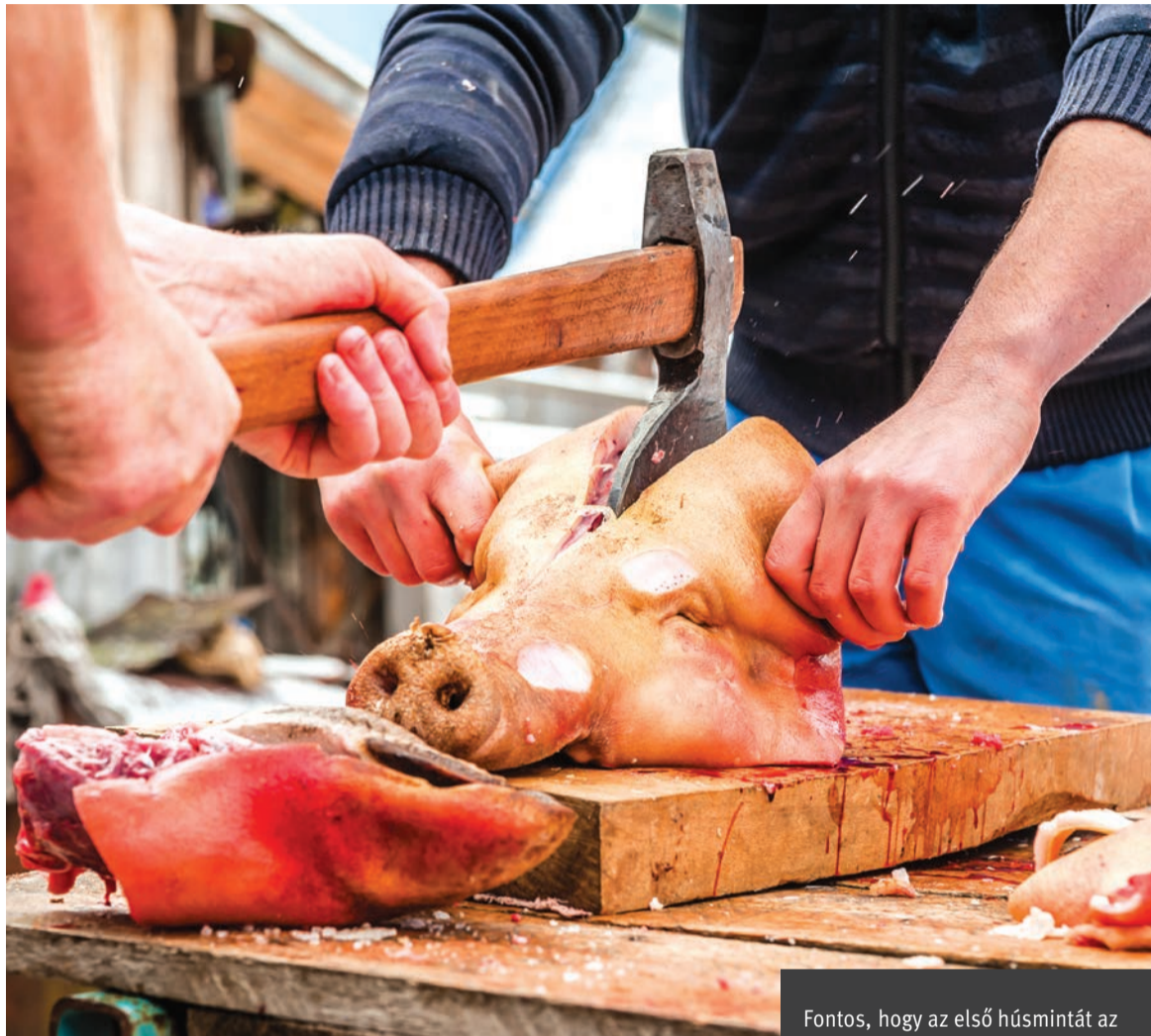
Fontos, hogy az első húsmintát az állatorvos kapja