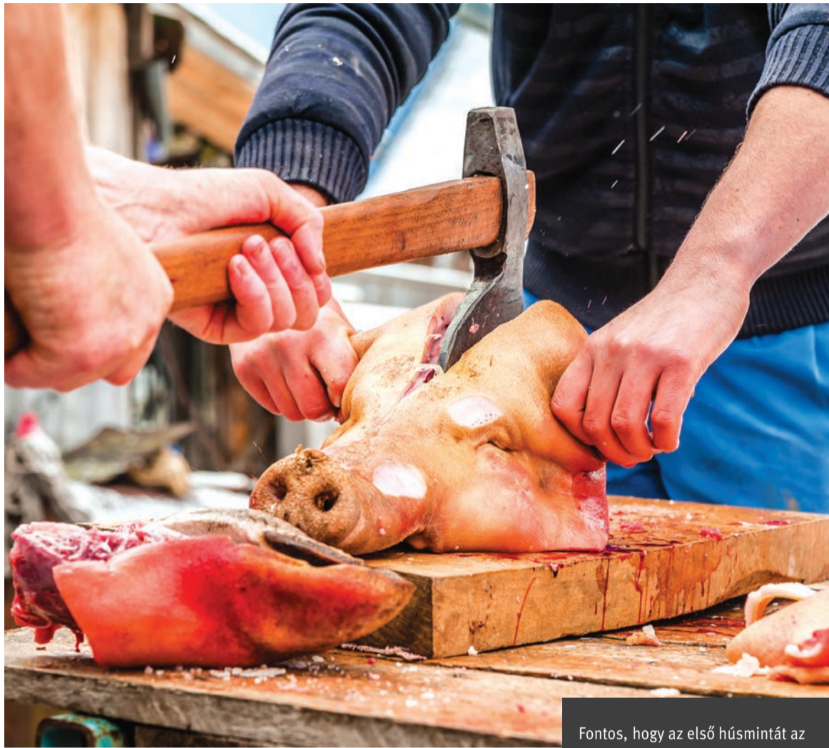
Fontos, hogy az első húsmintát az állatorvos kapja