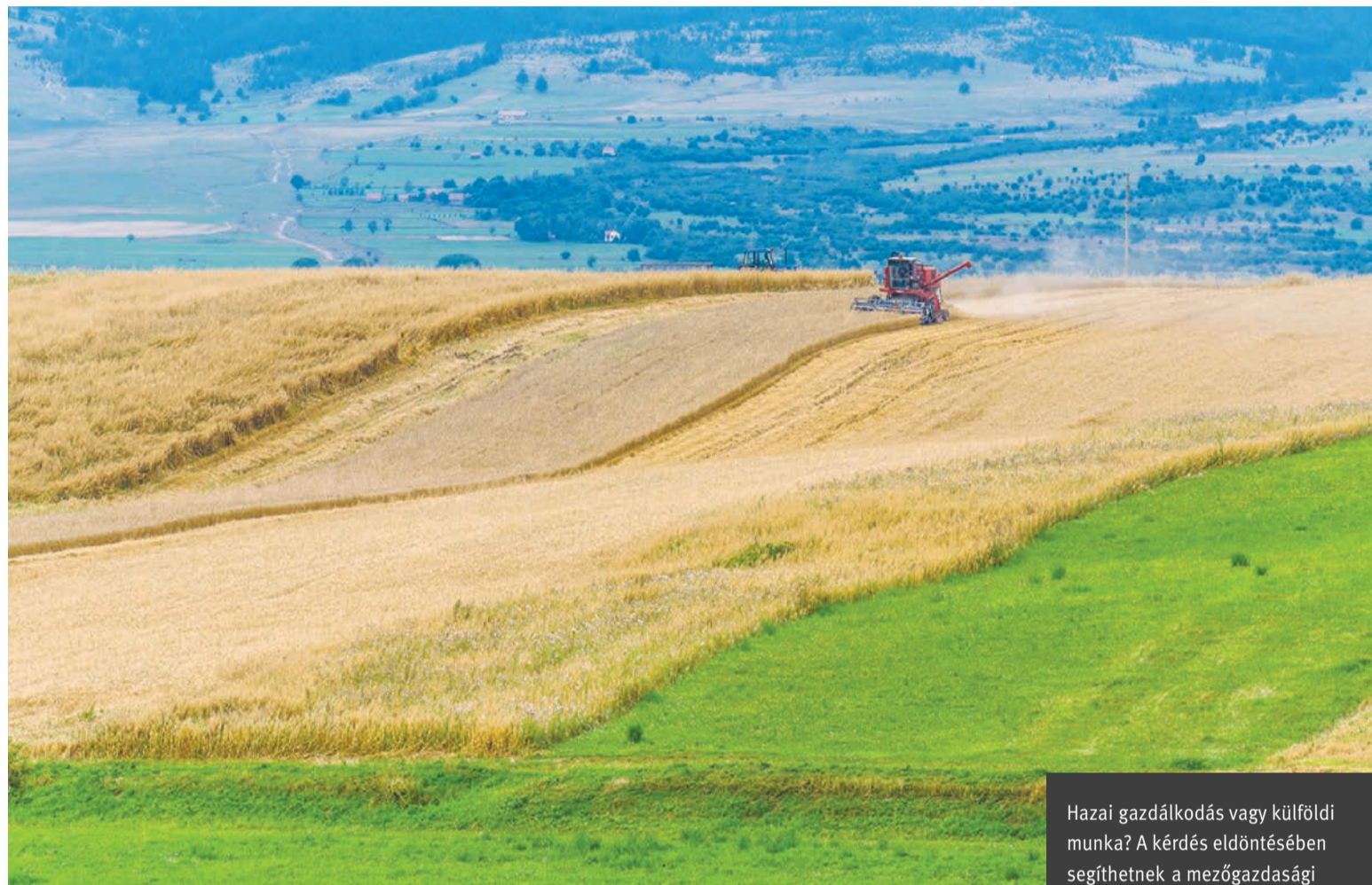
Hazai gazdálkodás vagy külföldi munka? A kérdés eldöntésében segíthetnek a mezőgazdasági támogatások

Az alaptámogatás mellett pluszjuttatások is kaphatók bizonyos