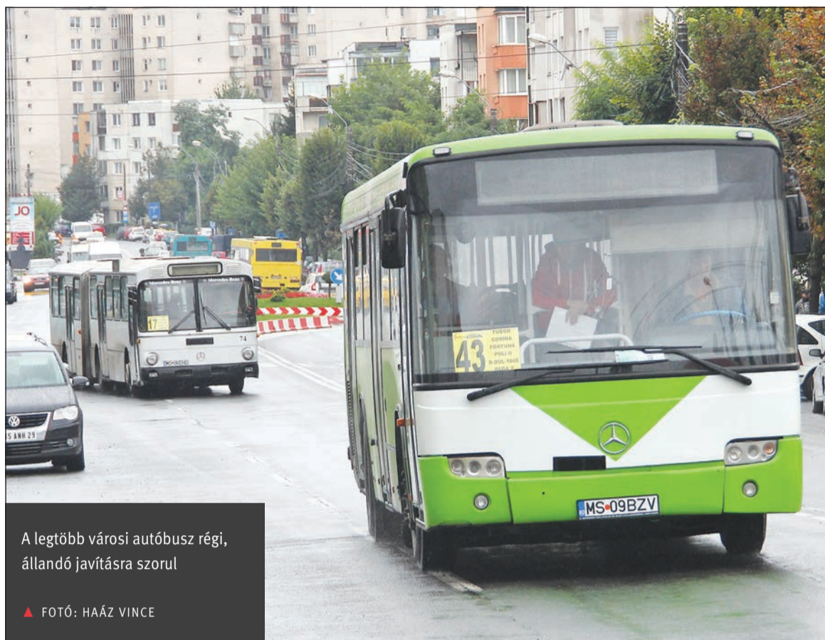
A legtöbb városi autóbusz régi, állandó javításra szorul