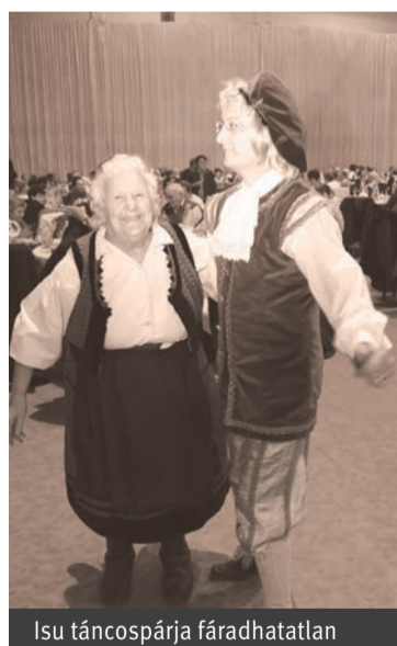
Isu táncospárja fáradhatatlan

Kétfeltesen találkoznak, tanulnak, tapasztalnak, beszélgetnek. Lett egy negyedik lába is életasztaluknak – az otthon, a napi feladatok és a templom mellett. Tudják, hogy „a járt utat a járatlanért el ne hagyj” mondás ismételtetése gátja is lehet