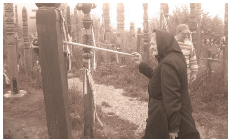
Nyergestetőn: „ott eresztik legmélyebbre gyökerüket a vén törzsek”

A máréfalvi mint első Caritas-idősklub nem öregedett el, mert