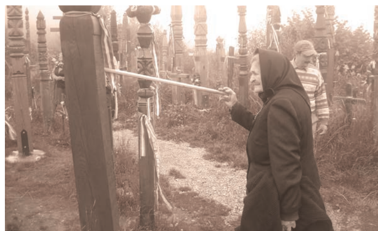
Nyergestetőn: „ott eresztik legmélyebbre gyökerüket a vén törzsek”

A máréfalvi mint első Caritas-idősklub nem öregedett el, mert