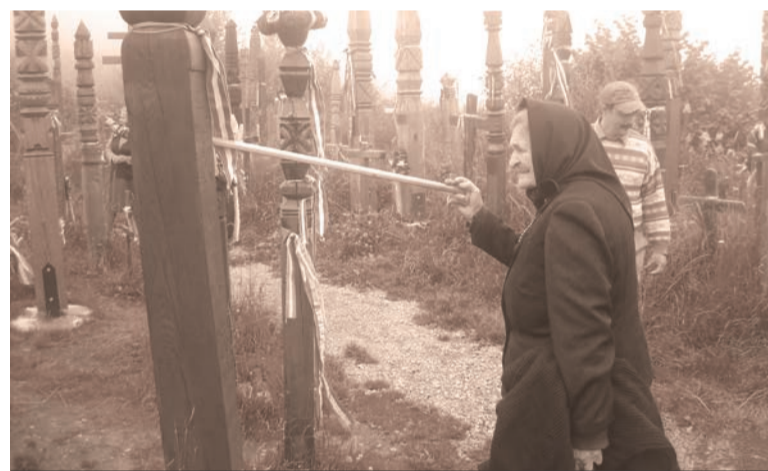
Nyergestetőn: „ott eresztik legmélyebbre gyökerüket a vén törzsek”

A máréfalvi mint első Caritas-idősklub nem öregedett el, mert