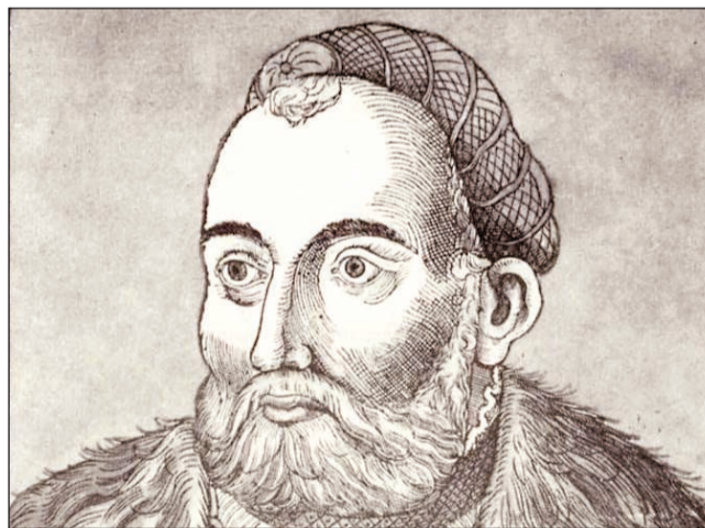
Szapolyai János hiteles portréja (Erhard Schön fametszete)