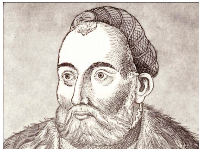
Szapolyai János hiteles portréja (Erhard Schön fametszete)

Sepsiszentgyörgy is kapott kiváltságlevelet. A székely mezőváros sokáig küzdött a levélben rögzített kiváltságok érvényesítéséért. Ez egyúttal azt is jelentette, hogy az oppidum jelentős mértékben függetlenedett a széki hatóságoktól, ami viszont kiváltotta a főemberek elégedetlenségét. Az előkelők ugyanis nem vették figyelembe a szabadságjogokat, s többféleképpen is megsértették azokat. A polgárokat a kiváltságokkal ellentétes fizetésekre, illetve katonáskodásra kényszerítették, miközben ők maguk és embereik a városi hatóságoknak ellenszegültek, a városlakókat pedig rendszeresen zaklatták. A szék és a fennhatósága alól kiváló mezőváros konfliktusát érzékelhetjük az utolsó Jagelló-király