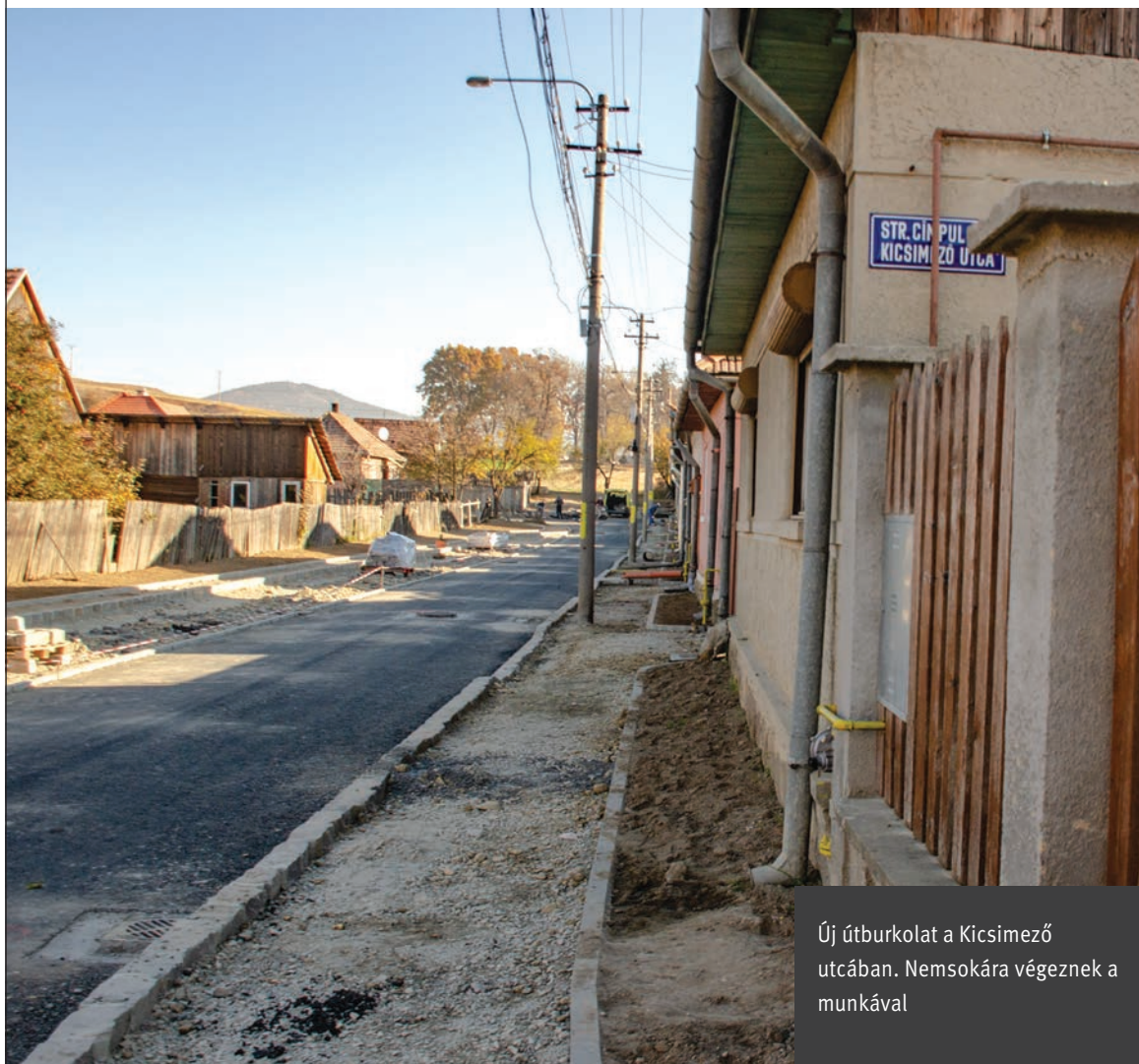
Új útburkolat a Kicsimező utcában. Nemsokára végeznek a munkával

● Csíkszereda zsögödi városrészében több év várakozás után jelentős útfelújítások készültek el idén, a munkát pedig folytatni szeretnék. A következőkben a Zsögöd utcában készülhet aszfaltburkolat.