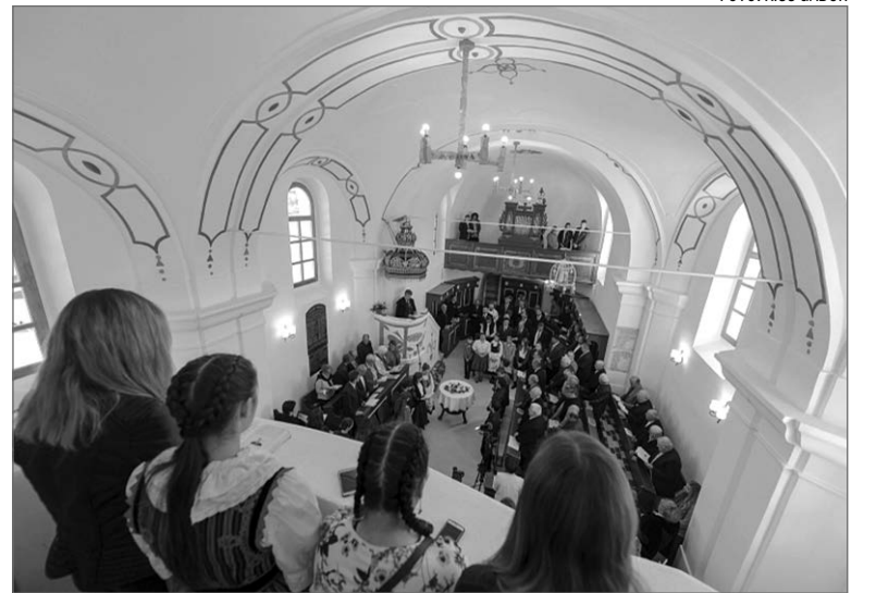
Új kezdet. A hétfőgőn ünnepeltek a mezőbergenyei hívek