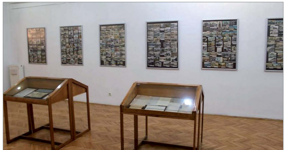
A kiállítás a Redutban kapott helyet, amely szerves része a kincses város történelmének