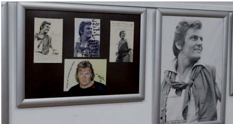
A tárlaton ráismerhetünk számos színészre, filmszillagra, közöttük Florin Piersicre is

A kiállítás olyan épületben kapott helyet, amely szerves része a kincses város történelmének, hiszen falai között – az egykori Redutban – koncertezett mások mellett Liszt Ferenc is 1846 novemberében 500 főnyi közönség előtt.