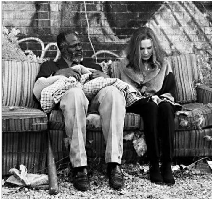
Segítőkéz, és segítségre szorul, ezért egy hajléktalan lesz a barátja

M egtörtént események alapján készült a film, amelynek főhőse egy családanya, aki halálos betegséggel küzd, de közben erős empátiát érez a nálánál is elesettebbekkel szemben. Férje, Ron Hall sikeres műkereskedő, aki látszólag boldog házasságban él vele, csak hogy, bár környezetükben senki sem sejtí, kapcsolatuk valójában súlyos válságban van. Ron sze-