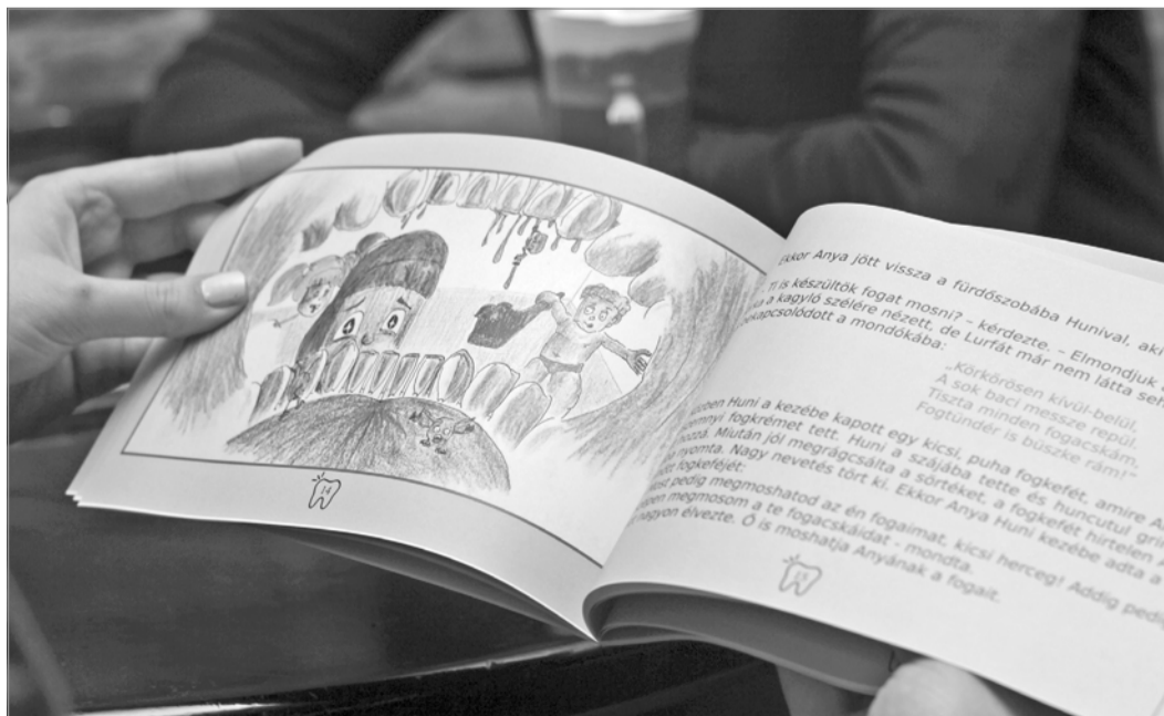
Illusztrációk színesítik a mesekönyvet

Bár ez volt első írói próbálkozása, a meseíró fogorvos nem zárkózik el a folytatástól sem, kapott pár tippet is arra nézve, hogy milyen tematikát dolgozhatna fel egy következő mesében. Van, aki ugyanis a vadonban történő fogmosásról szeretne olvasni, mások meg a fogszabályozásról vagy a nagymama protéziséről is.