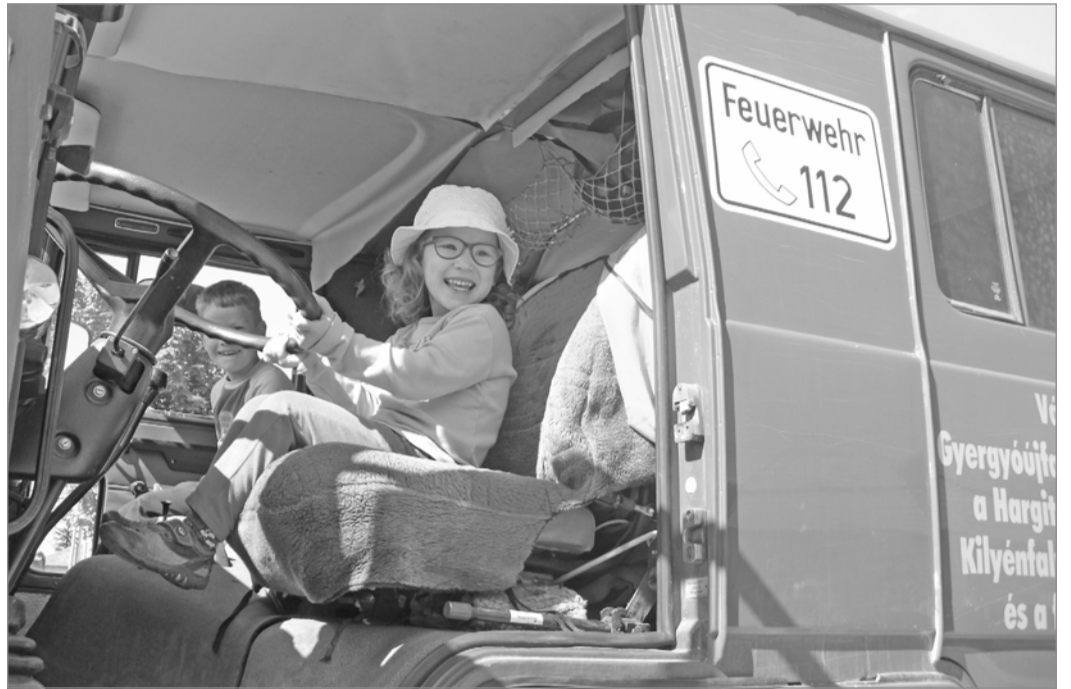
Tűzoltók találkoztak, gyerekek örültek a vásártéren

A megnyitót követően a tűzoltóautók szemléje következett, a gyerekek minden kis gombrol tudni akarták, mi az. A tűzoltók pedig ezúttal nem siettek, nem voltak bevetésen, türelmesen magyaráztak a csöppsegeknek, a kicsik még azt is kipróbálták, milyen a célba lövés víz-sugárral. Többen közülük már meg is fogalmazták: tűzoltók lesznek. A felszerelések, autók megtekintése után a környező települések alakulatainak bemutatója következett, és a gyergyószentmiklósi vöröskeresztesek az elsősegélynyújtást ismertették, ezt követően pedig megemlékeztek az önkéntes tűzoltó csapatok.