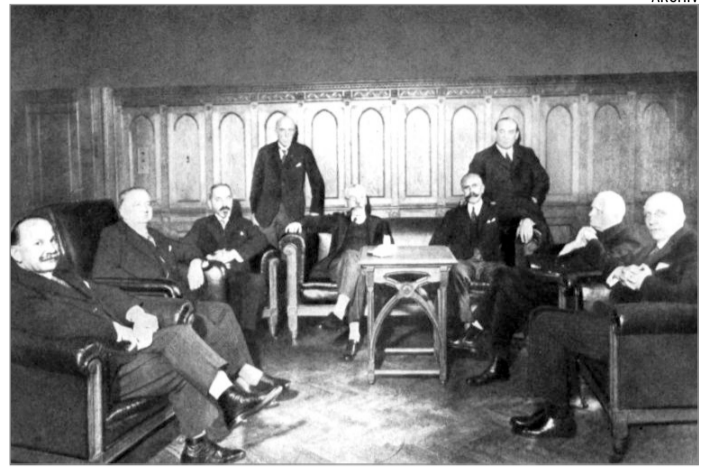
A második Károlyi-kormány 1931-ben – középen a miniszterelnök

Károlyi Gyula Trianon után hosszú időre visszavonult a po-