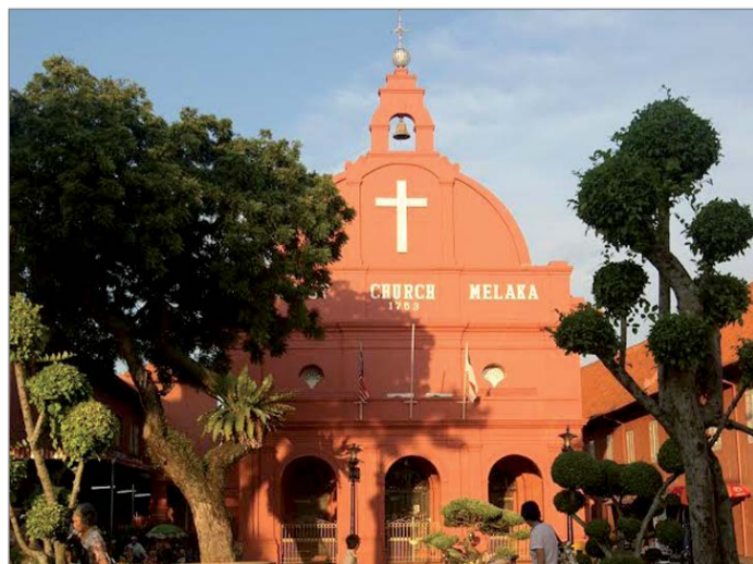
Holland templom Melakában

A maláj kereszténység bölcsője Melaka. Egykor a Maláj-félsziget legjelentősebb kikötővárosa volt, ma már inkább a múltjából és a turistákból él. Melaka az ország történetének skanzenje, színes kínai és indiai negyed teszi az idelátogató számára vonzóvá, s a régi európai épületek között a messziről jött idegen is otthon érezheti magát. A csatornarendszer különösen az esti kivilágításban kívánczik a fényképezőgépek lencséjére. Az érdeklődő gazdagon berendezett múzeumokban ismerheti meg a város múltját, az ország kultúráját. A megfáradt idegen estén-